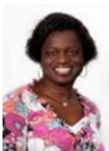
Noortje Enkhuizen Woonkwartier

Elke eerste dinsdag van de maand van 9:00-11:00 vrije inloop in dorps huis Ons Stedeke.