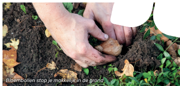
Bloembollen stop je makkelijk in de grond

Dit najaar gaan we samen zoveel mogelijk planten. Denk aan bomen, struiken, vaste planten en bollen. Want een bloeiende lente, plant je in de herfst!