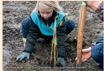
Bomen voor in de tuin zijn er in vele soorten en maten

Het najaar is hét moment om bloembollen te planten, als je in het voorjaar wilt genieten van tulpen, narcissen en andere vroege bloeiers. Maak het jezelf eens makkelijk: plant de bollen tussen bodembedekkende vaste planten, zoals vrouwenmantel (Alchemilla) of oivevaarsbek (Geranium).