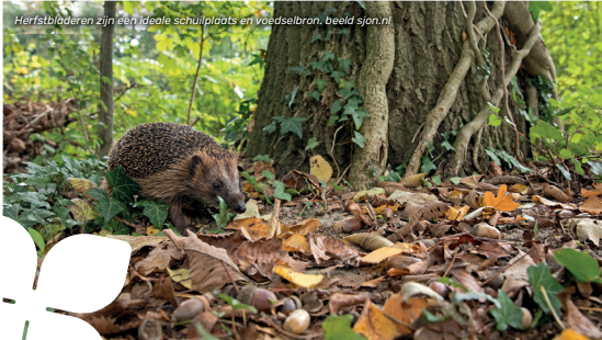
Herstbladeren zijn een ideale schuilplaats en voedselbron

Het najaar is het ideale seizoen voor de aanplant van bomen, struiken, vaste planten en bollen. Want door te planten in de herfst, kunnen de wortels goed aarden en geniet je in het vroege voorjaar al van een groene en bloeiende tuin. En bovendien is het fijn om lekker buiten bezig te zijn!